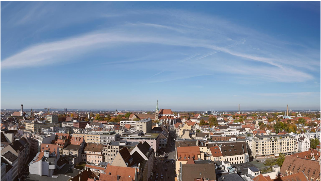
Blick auf den Dom